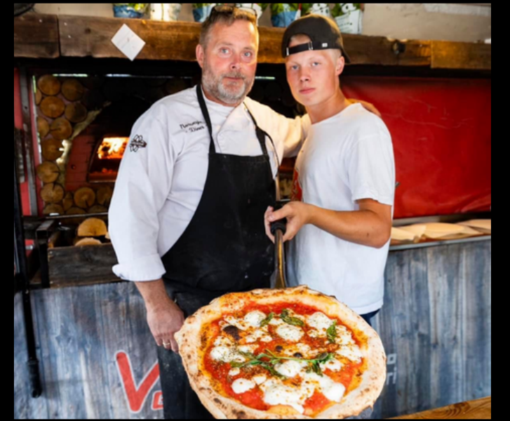
ÅRETS STREETFOODUTSTILLER 2023 GIKK TIL VEDOVNSPIZZA