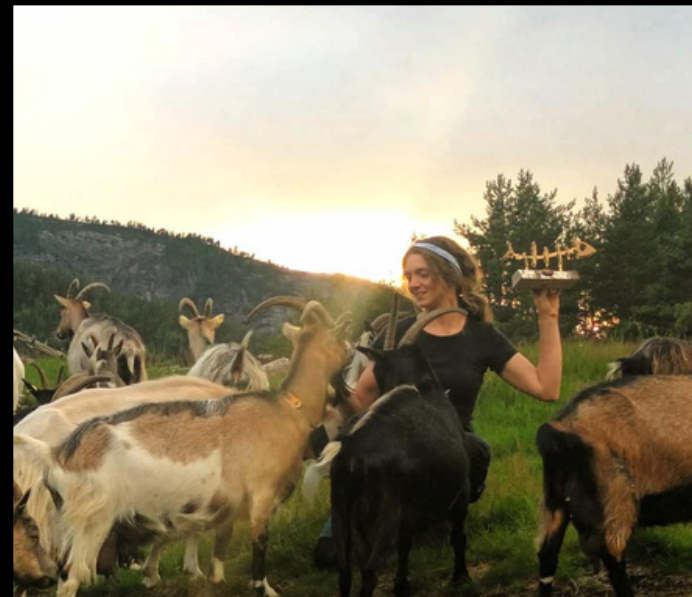
ÅRETS UTSTILLER 2023 GIKK TIL UPPISTOG GÅRD