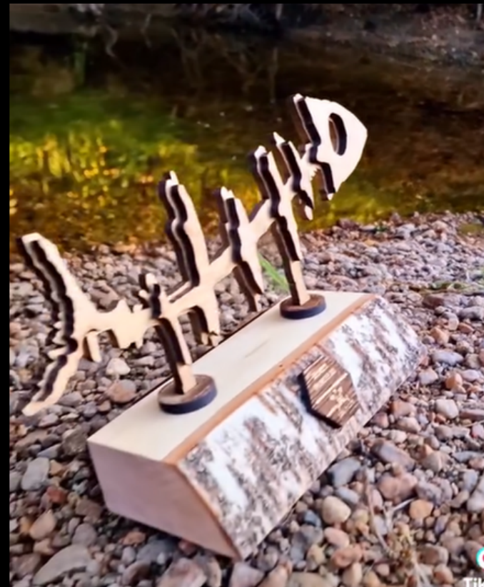
PRISEN DESIGNET AV KREATIVPROFESSOR - LOGOMOTIVET AS