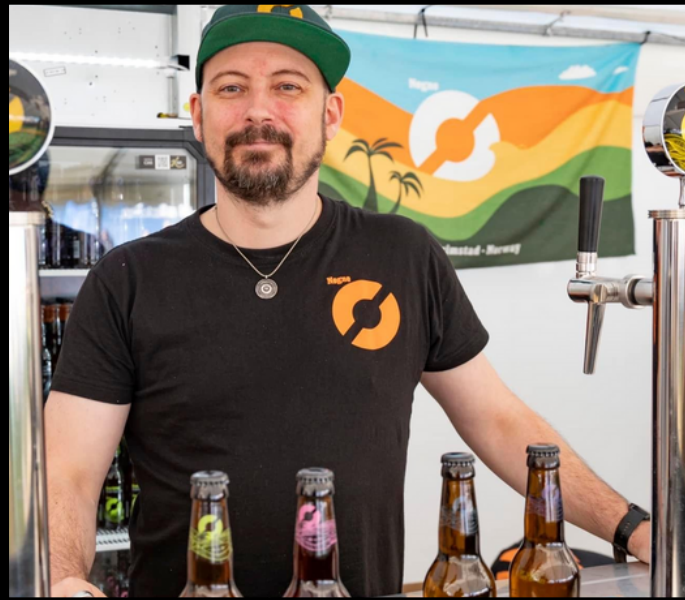
ÅRETS ØL 2023 GIKK TIL NØGNE Ø

JURYEN VIL BESTÅ AV KJENTE LOKALE MAT OG DRIKKE-ENTUSIASTER